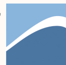
TABLE DE CONCERTATION SUR LES PAYSAGES

Pour en savoir davantage sur l'étude, vous pouvez vous rendre sur le site Internet de la municipalité où il sera possible, au cours de prochains mois, de consulter le rapport final.