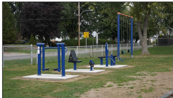
Mario Godbout, conseiller municipal

D'ici la fin de l'automne, cinq nouvelles tables de pique-nique seront fixées sous l'abri ainsi que de nouvelles poubelles de recyclage qui seront installées à divers endroits du parc.