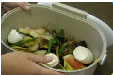
Restes de table